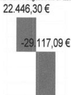
Einnahmen / Ausgaben bis 3. Quartal 2018